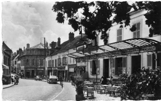
La Brasserie Bellevue, rue des Ponts

Ensuite l'opportunité de racheter la Brasserie Le Bellevue, lieu évocateur de cette période, situé à proximité, a été saisie. De futurs travaux permettront d'en faire une brasserie à vocation culturelle, le « restaurant du musée hors les murs », destiné à irriguer et à dynamiser le centre ville en complément de l'offre exist-