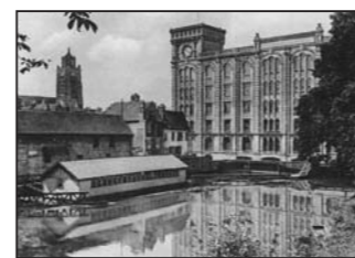
le Bateau Lavoir

Grâce à l'action de l'association des moulins à vent champenois, le village de Dosches dans le secteur du Parc Naturel de la Forêt d'Orient a pu recréer une grange champenoise, un moulin à vent du XVII e siècle -devenu emblématique par le chantier d'insertion lors de sa construction et par l'atout touristique qu'il re-