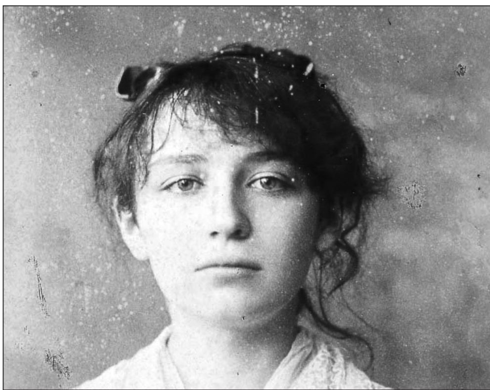
visage de Camille Claudel

Lors de sa séance du 9 juillet dernier le conseil municipal a décidé de l'acquisition d'un ensemble de près de 80 œuvres de Camille Claudel afin de créer, à terme, à Nogent-sur-Seine, la ville qui a révélé son talent, le musée Camille Claudel qui n'existe pas aujourd'hui de par le monde. Par ailleurs, la ville affirme son soutien au développement économique en apportant sa participation au laboratoire de Recherche&Développement agro-industriel international du Groupe Soufflet. Un chantier d'insertion a, de plus, été lancé pour recréer avec des jeunes et des demandeurs d'emploi un bateau-lavoir, patrimoine populaire évoquant les pratiques domestiques des Nogentais de la fin du XIX e siècle.