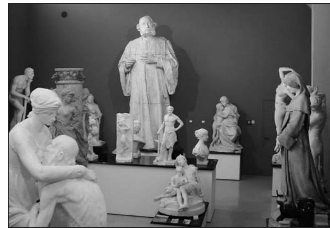
la galerie des sculptures du Musée du Bois-Boucher

animer au service d'une vision claire et d'une ambition forte pour Nogent-sur-Seine dans les années à venir. La culture et le patrimoine sont ici des outils au service d'une politique de développement local profitant à tous les habitants et influant considérablement sur l'image de la ville. Longtemps Nogent-sur-Seine a été la ville de la centrale nucléaire - et l'est encore pour beaucoup. Elle est aujourd'hui citée pour ces investissements industriels récents. Par cette décision, le conseil municipal maintient un équilibre entre développement économique, attractivité touristique, offre culturelle et vie quotidienne. L'image de Nogent-sur-Seine en sera, dans les années à venir, immanquablement modifiée pour tendre vers celle d'une ville d'art et d'histoire, avec une offre culturelle et touristique de qualité, vers une ville de sculpture, celle de Camille Claudel