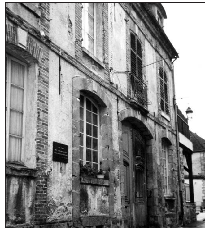
la maison de Camille Claudel, rue Saint-Epoing

Ces dernières années, Nogent-sur-Seine a bénéficié d'un développement économique hors norme qui se traduit par des retombées fiscales nouvelles donnant à la collectivité les moyens de ses ambitions. Les bases de taxe professionnelle ont varié de + 50% entre 2005 et 2008. Ces bases augmenteront de nouveau fortement au cours des 5 prochaines années, grâce aux nouveaux investissements (plus de 200 M€ prévus sur le port rive gauche et sur les Zones Fontaine-Baron et des Guignons. Comparativement, en 2005, alors que les bases